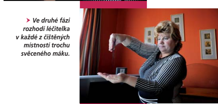
► Ve druhé fázi rozhodí léčitelka v každé z čištěných místností trochu svěřeného máku.