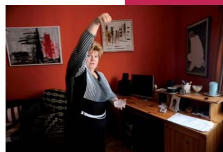
◀ Na závěr se očištěný prostor vykropí svěcenou vodou.